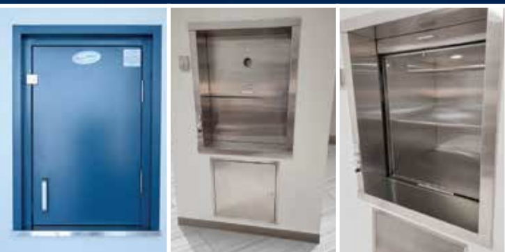
Porte palière battante